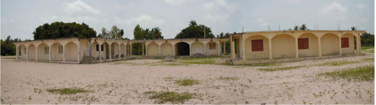
Panoramica della scuola media

La scuola media di Niodior (Collège d'Enseignement Moyen) fa parte di un complesso scolastico comprendente anche le scuole medie superiori (Licée), situato all'esterno del villaggio, a circa mezzo chilometro a sud dallo stesso. Attorno alle scuole ci sono gli orti del villaggio.