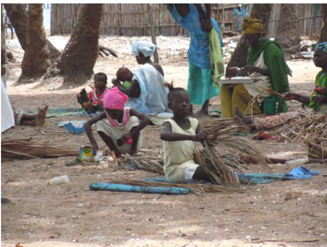
Ragazze che preparano stuoie