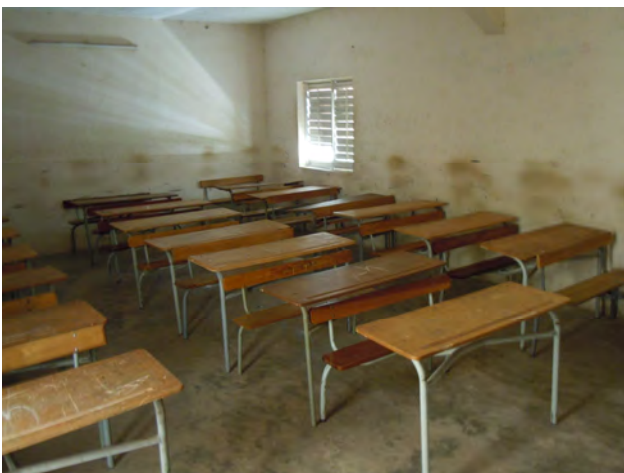
Banchi con panche fisse

Le classi sono miste e generalmente le ragazze sono un po' più della metà degli allievi. Ora le ragazze sono tutte scolarizzate, ma in passato le famiglie erano reticenti a mandarle a scuola.