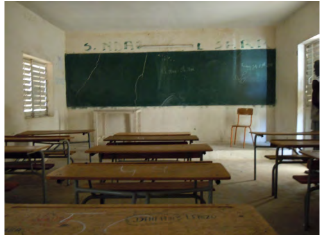
Lavagna e cattedra

Questa scuola media raccoglie ragazzi provenienti anche dalle altre isole, che trovano alloggio presso le famiglie dei parenti.