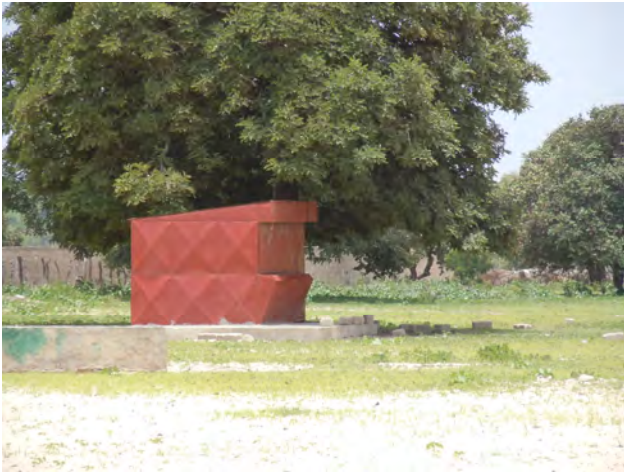
Botteghino nel cortile