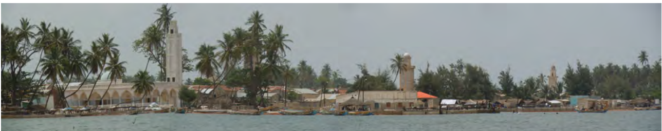
Il villaggio visto dal mare

Il villaggio ha una popolazione di circa 10'000 persone, ma una parte importante (stimata tra 1/4 e 1/3 del totale) è migrata. Sono soprattutto i giovani uomini che emigrano in cerca di fortuna: le mete principali sono la capitale Dakar, la città di Kaolack e la Gambia, che confina a sud con il delta del Saloum.