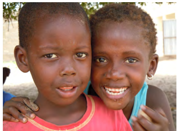
Bambini del villaggio