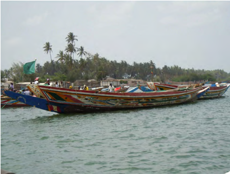
Piroghe nel porto di Niodior

-i trasporti via mare con le piroghe: esistono delle piroghe taxi per il trasporto delle persone e delle grandi piroghe adibite al trasporto delle merci (queste ultime sono simili a quelle che, riempite di gente all'inverosimile, cercano di raggiungere le coste della Spagna in cerca di fortuna). Le merci trasportate sono principalmente le conchiglie caricate in alcune isolette vicine, e usate al posto della ghiaia nel cemento armato; il sale ricavato da alcune saline situate nell'isola e mercanzie varie (anche di contrabbando) provenienti dalla vicina Gambia.